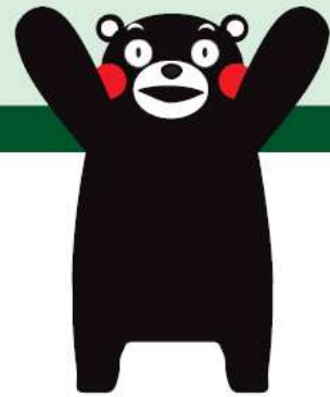
くもとサプライズキャラクター くまモン

熊本県と県内市町村は、平成25年度までに個人住民税の特別徴収事業者への完全指定を実施します。