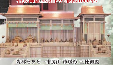
森林セラピー市房山 市房杉 三棟御殿

自然と森林資源に恵まれ、たふるさと球磨・人吉の、市房山銘木市房杉、五木の標、白髪岳の松に代表される銘木の産地として全国に知られていきます。相良八百年の歴史を誇るこの地で豊かな木の文化は育まれ受け継がれてきました。この地で豊かな森林セラピー木の文化を体験できます。