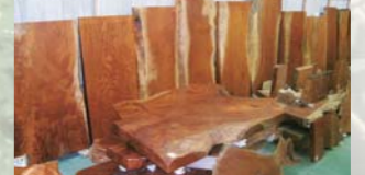
ケヤキ玉壺コーナー

世界自然遺産登録地屋久島で育った屋久杉の原木を始め、全国から選りすぐられた、ケヤキ・ヒノキ・カエデ・黒柿・黒松等、素晴らしい銘木の種類の原木から盤木・板材等まで、数多く展示しております。天然素材のぬくもりとやさしさを形に心にしみわたる木の香りを体感出来ます。