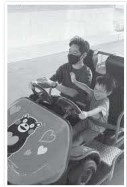
キャンプ場のゴーカートに大喜び

このコーナーは皆さんが普段思っていることを書いていただき、次の方へペンリレーするものです。次号の方への紹介は今号の筆者です。よろしくお願ひします。