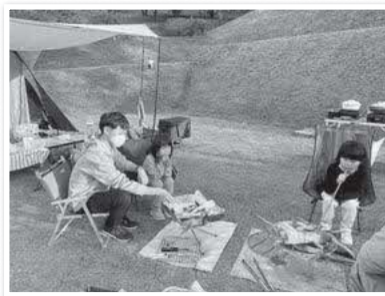
焚き火の火起こしにチャレンジ