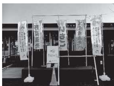
ふれあい交流センター「湯〜とぴあ」