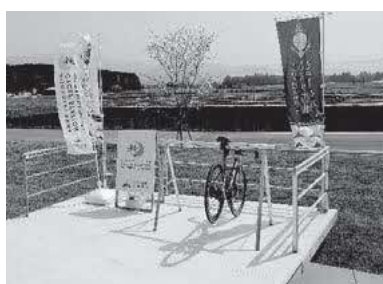
人吉海軍航空基地資料館 (ひみつ基地ミュージアム)