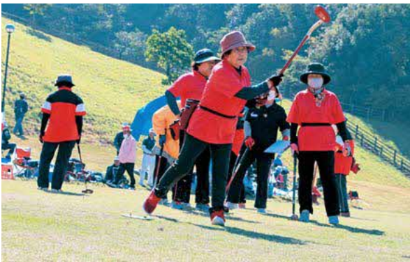
グラウンド・ゴルフ(女子)