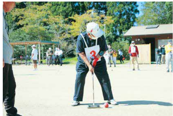
ゲートボール(男子)