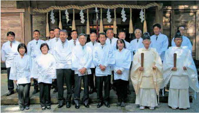
奉告祭に参加した関係者