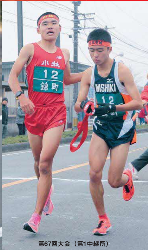
第67回大会(第1中継所)