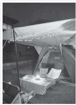
庭でのおうちキャンプ