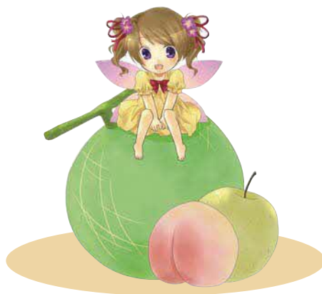
マスコットキャラクター にしきのももりん

まちづくりに寄与していると認める団体、個人または建物等の所有者、設計者、施工者、その他の関係者を表彰します。