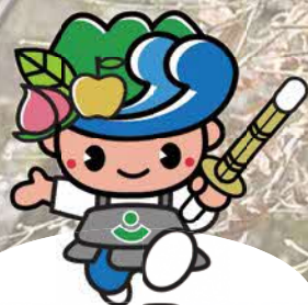
マスコットキャラクター 錦太郎