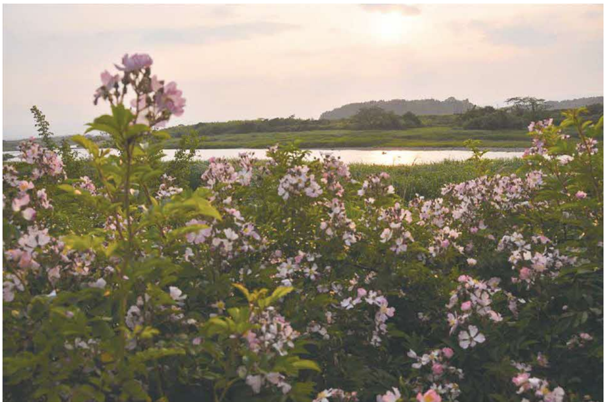
町の花「ツクシイバラ」

そこで、錦町の優れた景観や快適な環境を守り、育て、創り出すため、魅力ある郷土の形成と秩序ある開発を促し、誇りと愛着の持てる郷土の醸成に資することを目的とした「潤いと安らぎを守り育てる錦町まちづくり条例」に基づき、住みよい環境と快適な生活空間の想像を目指し、活力と魅力あるふるさとを後生に引き継ぐため、皆様の手によるまちづくり活動の推進を図りましょう。