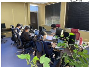
②(株)キャップドゥー・ジャパン http://www.capdo-jp.com/