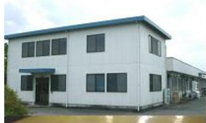
①日本三和エレクトロニクス(株) https://j-sanhe.co.jp/