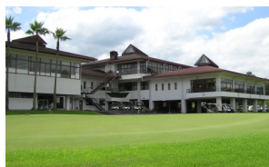
⑤球磨カントリー倶楽部 http://www.kuma.cc.com/