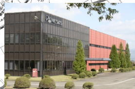
③ルネサスエレクトロニクス(株) https://www.renesas.com/jp/ja