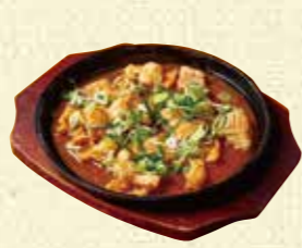
【彩食三味 ふじ】 ホルモン鉄板焼き