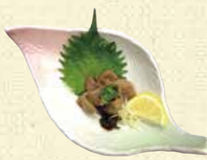
【喜楽苑】 鯉ホルモン