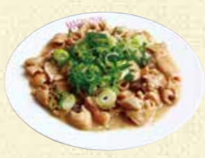
【珉珉軒】 味噌煮込み風ホルモン