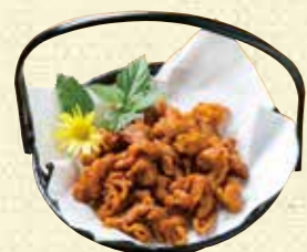
【ニューつねまつ】 ホルモンの唐揚げ