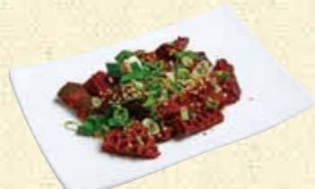
【お食事処 ふるさと】 黒ホルモン