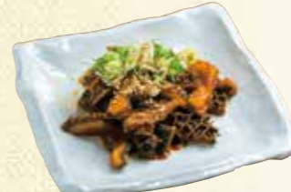
【市房食堂】 イチフサ黒ホルモン