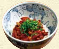
【味処みやざき】 ホルモン丼