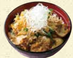
【パルティール福寿庵】 ほるもん丼