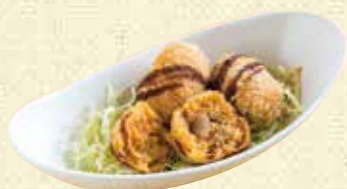
【レストランカフェ ペンギン】 ペンギンのタマゴ